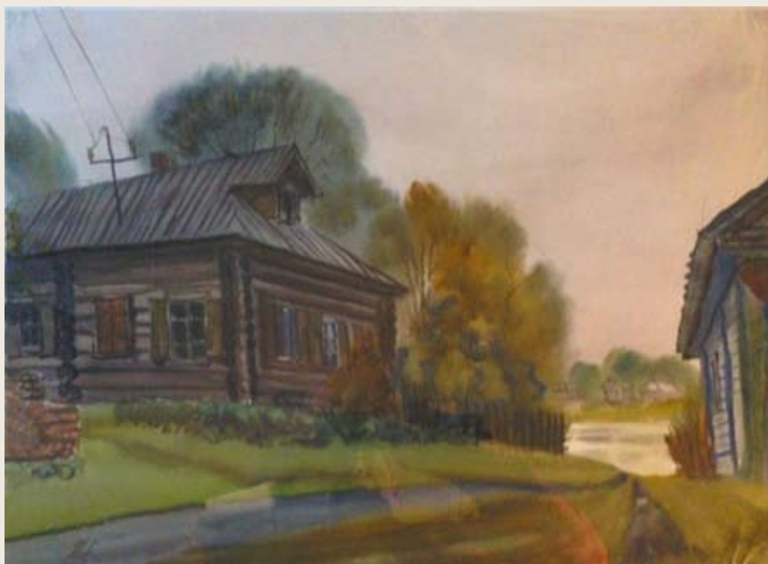
Каргополье. Русское село