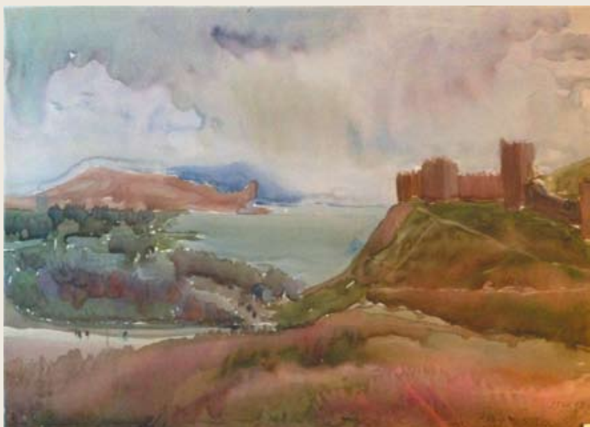
Крым. Судак. Генуэзская крепость