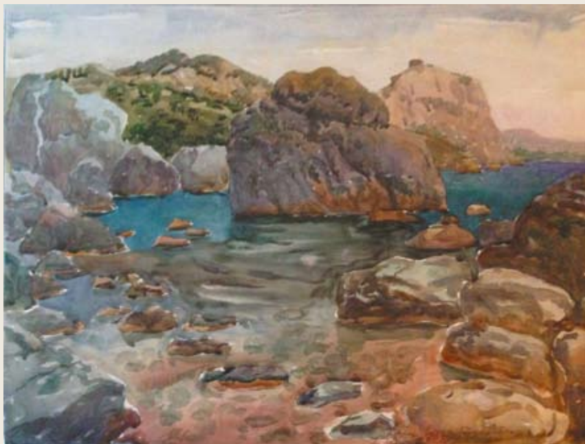
Крым. Судак. Бухта Тихая