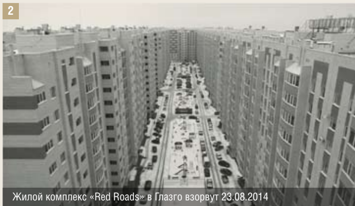
Жилой комплекс «Red Roads» в Глазго взорвут 23.08.2014