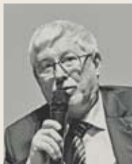
В.Н. Логвинов, архитектор, вице-президент Союза архитекторов России