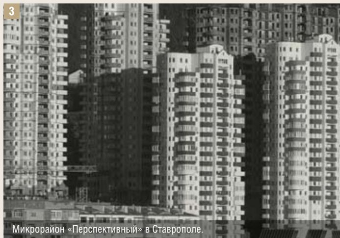
Микрорайон «Перспективный» в Ставрополе.