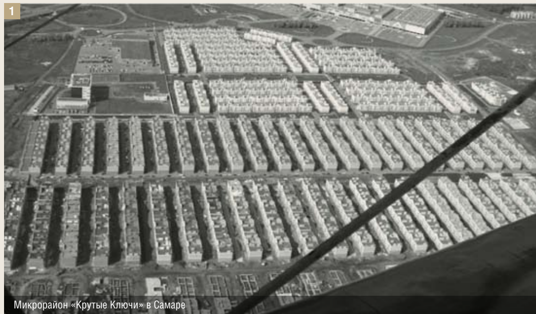
Микрорайон «Крутые Ключи» в Самаре

лучей проволоки с вышками, плаца для поверки и, главное, крематория. Нет барачной «композиции». Это нечто из промышленного, а вернее из агропромышленного строительства. Типа ПТИЧНОКОВ или КОРОВНИКОВ. СВИНАРНИКИ! Вот точный «архитектурный» образ. Ряды из десятков одинаковых зданий «облыжной» архитектуры – свиньи в композиции разбираются хуже, чем в апельсине. Минимальные расстояния между зданиями для выгула скотины, прямые проезды для подвоза кормов. Пусть отъедаются и дают щетину и сало к рождеству. А еще лучше проценты по ипотеке.