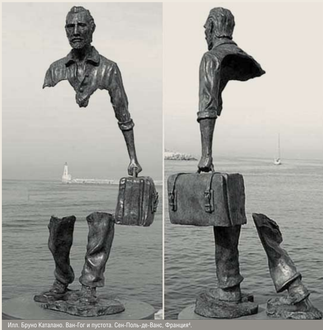
Илл. Бруно Каталано. Ван-Гог и пустота. Сен-Поль-де-Ванс, Франция 4 .

рень предмета, архитектура — это ОДЕВАНИЕ ПУСТОТЫ В МАТЕРИЮ. Это вычленение фрагмента пространства и упаковывание его в некие материалы. Внутри упаковки пространство также каким-то образом форматируется, нарезается и нашинковывается. Это приготовление пустот для потребления мы называем архитектурой 7 . Об эстетических качествах пустоты можно говорить только при наличии этого «обрамления». Аналогом взаимосвязи между пространством пустоты и обрамлением может быть картина и рама. Рама — важный элемент при экспозиции живописи, но рама не определяет ценностные качества картины. Цена рамы может увеличить стоимость картины, но не добавляет художественной ценности живописи. Рама скорее означает законченность творческого акта художника.