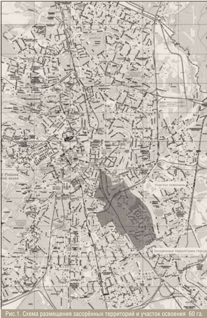
Рис.1. Схема размещения засорённых территорий и участок освоения 60 га.