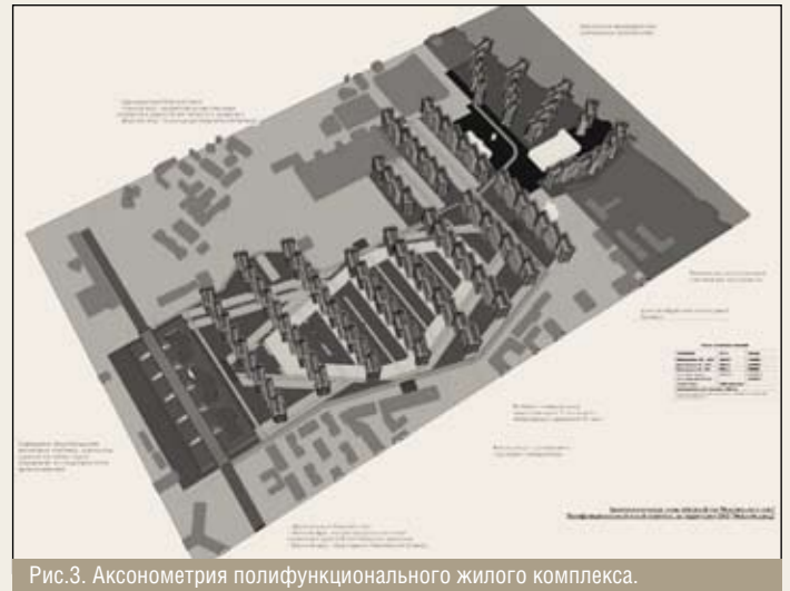
Рис.3. Аксонометрия полифункционального жилого комплекса.