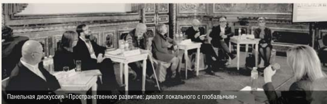
Панельная дискуссия «Пространственное развитие: диалог локального с глобальным»