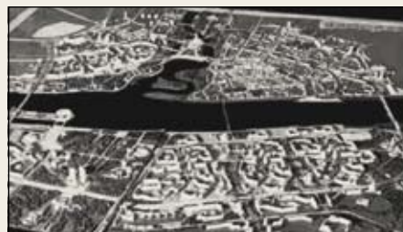
Ярославль – ПДП центра (1977, ГАП Ю.П. Шплет, арх. В.Е. Полищук, инженеры А.В. Ковалёва, Н.М. Верстова и др.).