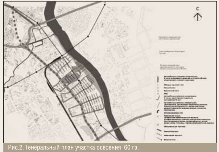
Рис.2. Генеральный план участка освоения 60 га.