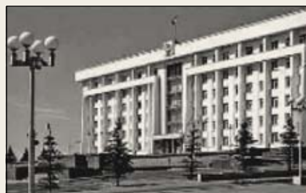
Уфа. Здание СМ БАССР (авторы Ю.П. Паечкин, В.Б. Залегаллер, Л.И. Игнатъева, построено)