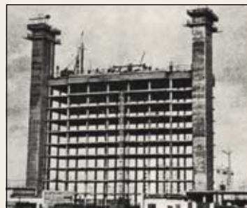
Строительство 14-этажного экспериментального здания института Ленгипрогор на ул. Бассейной по проекту сотрудников института – авторов арх. А.И. Белорусов, инж. Л.Б. Рейз и А.А. Майер.