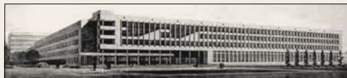
Строительство нового и реконструкция старого корпусов гидротехнического ф-та, авторы арх-ры В.П. Мухин, В.Б. Залегаллер, конструктор Л.И. Игнатъева.