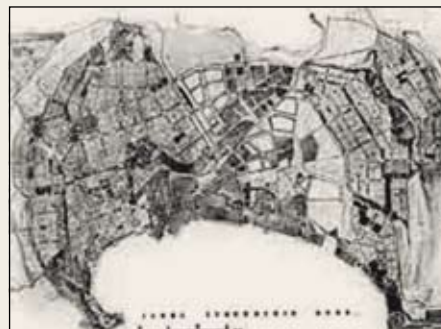
Баку – генеральный план города, 1936–1937 гг. Рук. проекта проф. Л.А. Ильин, основные авторы – архитекторы В.А. Гайкович, Н.В. Баранов (из альбома Гипрогора, Москва, «Гипрогор–85»)

■ Сотрудники бывшего института Ленгипрогор – РосНИПИУрбанистики просят Санкт-Петербургский Союз архитекторов обратиться в Администрацию города с предложением о создании в Санкт-Петербурге музея советского и российского градостроительства, в котором были бы собраны разнообразные материалы, хранящиеся в различных проектных институтах, мастерских и пр. организациях (как оригиналы, так и копии), касающиеся выполненных ими работ для самых разных уголков нашей страны и зарубежья.